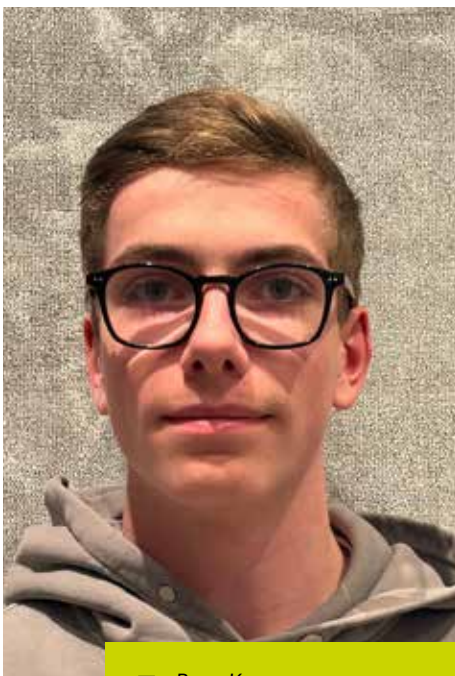
➤ Brego Kee

“We keken van tevoren al positief naar kernenergie en wilden weten of het rechtvaardig was. We zijn allebei geïnteresseerd in de politieke omstandigheden betreffende kernenergie. We wilden graag weten welke kant van het verhaal echt klopte om zo beter een onderbouwde mening te kunnen vormen”, leggen ze uit. “We zijn oppervlakkig begonnen en kwamen toen veel dingen tegen die we al wisten. Toen we dieper in het onderwerp doken, kwamen we nieuwe technieken en ontwikkelingen tegen die ons erg verrasten en waar we blij mee zijn dat we ze nu wel kennen. Voorbeelden hiervan zijn gen IV-reactoren, Small Modular Reactors en uraniumwinning