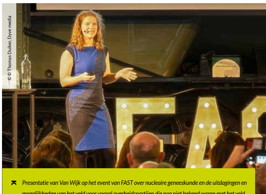
➤ Presentatie van Van Wijk op het event van FAST over nucleaire geneeskunde en de uitdagingen en mogelijkheden van het veld voor vooral overheidspartijen die nog niet bekend waren met het veld.

Van Wijk is ook betrokken bij de organisatie van een weekend voor masterstudenten uit technische en medische opleidingen, om hen kennis te laten maken met het nucleaire geneeskundige veld. “We willen ze laten zien hoe medische isotopen worden geproduceerd en hoe ze bij de patiënt worden toegepast. Hopelijk raken de studenten geïnspireerd door de carrièremogelijkheden die de nucleaire geneeskunde kan bieden.” Ze benadrukt dat er meer aandacht moet komen voor nucleaire geneeskunde, niet alleen bij masterstudenten, maar ook bij hbo’ers en mbo’ers. “Uiteindelijk moeten we het allemaal samen voor elkaar zien te krijgen.” Na de zomer hoopt Van Wijk haar thesis te verdedigen. Als technisch geneeskundige hoopt ze aan de slag te blijven in het Radboudumc, om nieuwe innovaties in de kliniek toe te passen. Daarnaast wil ze als projectmanager blijven bijdragen aan DECISIVE en NUCMED-NL. “Ik zou het geweldig vinden om enerzijds op de werkvloer te staan en tegelijkertijd als een helikopter boven de innovaties te vliegen, om te kijken hoe we nieuwe technieken in de praktijk kunnen brengen.” K